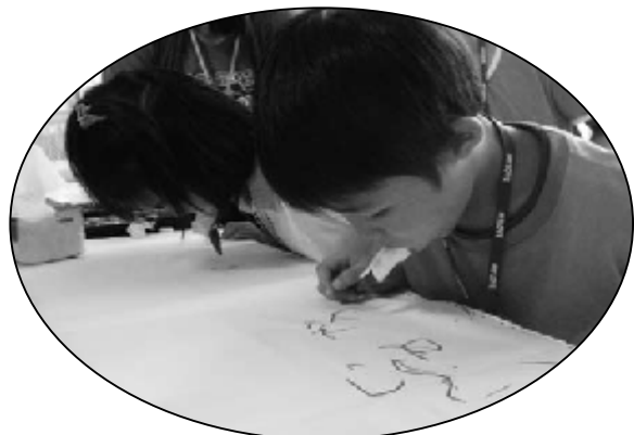
體驗活動——以嘴代手畫圖

* 接著依據各種障礙類別安排體驗活動，如： — 獨臂穿衣體驗：單手臂障者之不便； — 咬筆畫圖體驗：雙手肢障者之不便；