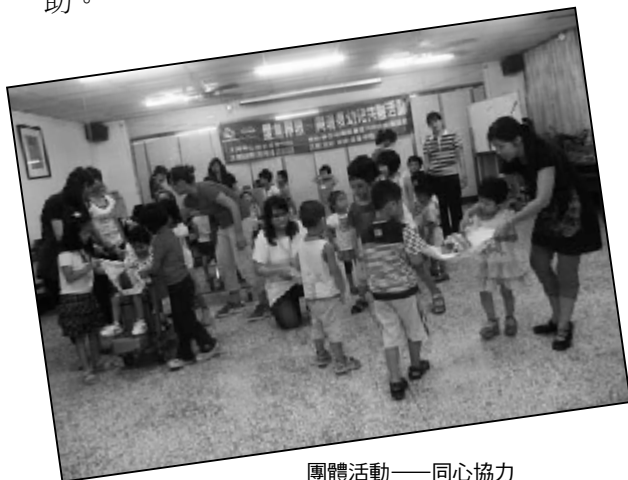
團體活動——同心協力

* 最後則是進到班級與特幼兒一起上課，就近觀察特幼兒上課及使用輔具的情形，並學習與其互動之模式及如何適時地提供協助。