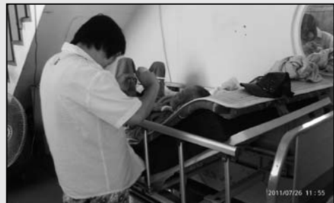
8 為生病無法起身的爸爸募集可調式病床，老爸爸得起來吃東西，方便智障女兒日常生活的照顧。