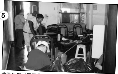
5 會同瑞復外展工作隊為髒亂不堪的家進行打掃