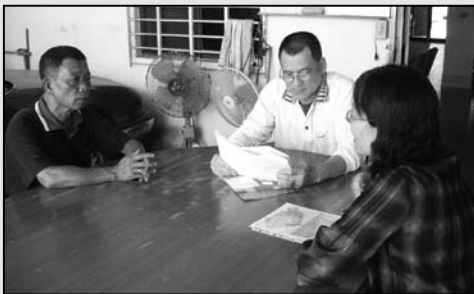
2 主動拜訪安平區里長，進行服務宣導。