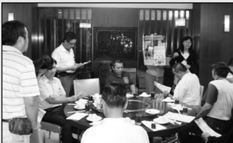
3 利用安平區里長聯誼會時進行方案宣導，希望里長伯能協助憨老家庭。