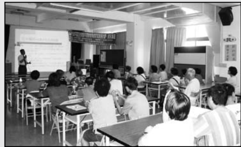
6 家長資訊講座——邀請安平區社政課長為家長說明福利項目