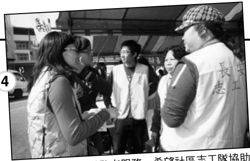
4 到社區活動中宣導憨老服務，希望社區志工隊協助本方案服務。

目前全台仍有眾多的憨老家庭，生活在我不知道的角落，等待著社會資源的協助！我們深信，透過憨老家庭服務計畫，協助智能障礙者與家庭得到社會的照顧，減輕家長在長期照顧上的負擔，提升家庭在社區內的生活品質，營造健康祥和的社會。邀請您一同與我們關心身邊的雙老化家庭！