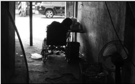
1 憨老家庭默默在社會的角落等待社會資源的協助...