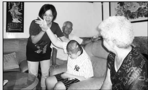
7 專家到宅服務-連結職能治療師到宅評估