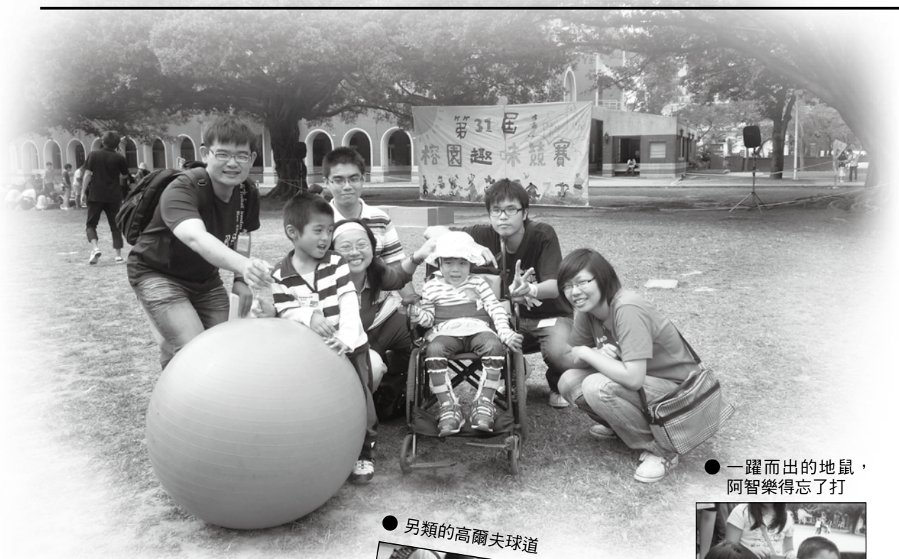
● 一躍而出的地鼠，阿智樂得忘了打