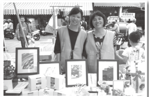
我們有氣質的義賣品