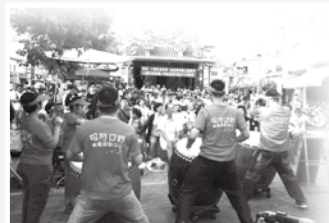
鼓隊在安平妙壽宮前表演