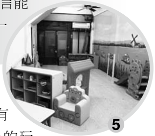
圖示：1.生活扮演區；2.益智挑戰區；3.親子學習區；4.語文閱讀區；5.親子遊戲區