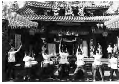
▲士林慈誠宮為媽祖祝壽