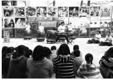
▲好山好水的電光國小