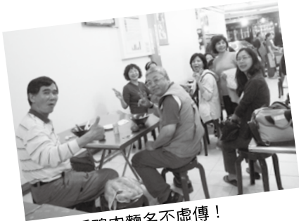
▲礁溪鴨肉麵名不虛傳！