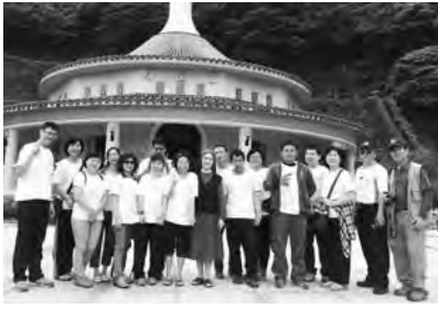
▲五峰旗聖母朝聖地教堂留影