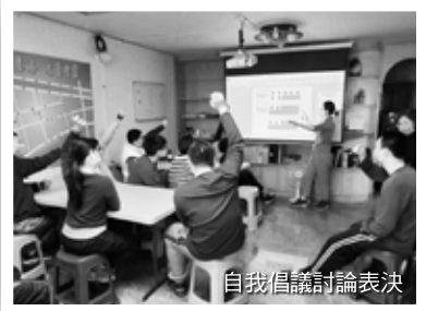
自我倡議討論表決