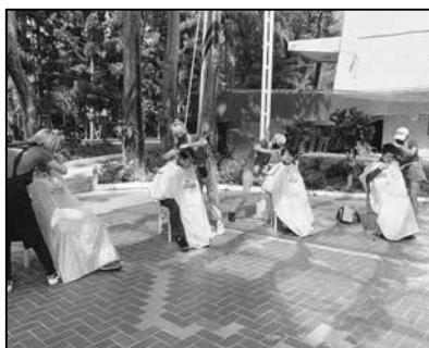
米蘭安平本部義剪