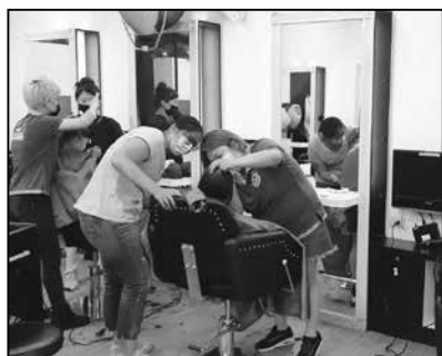
米蘭安和二店義剪