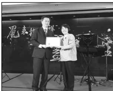
鼠來報吉祥公益圍爐晚宴