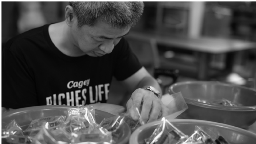
將近三十年的白天都來瑞復接受職能治療與生活自理訓練的智強，讓自己不會成為家人無法喘息的重擔。

興趣，甚至參與糖果、文具、艾草條等包裝代工，中強可以一邊強化身體與心智機能，一邊累積成就感與滿足感，不讓自己成為家人無法喘息的重擔。