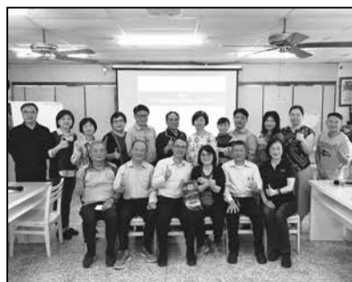
學校員生消費合作社