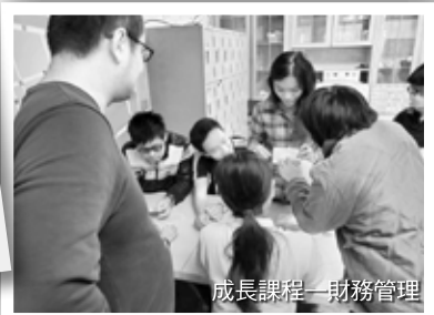
成長課程—財務管理