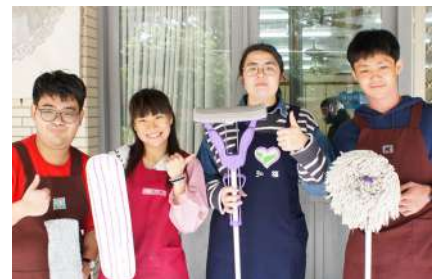
結訓後快樂合照，祝彼此在職場上能發光發熱。