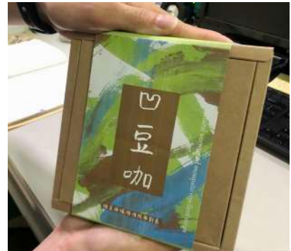
包裝腰封主視覺設計皆為幼兒服務對象之繪畫作品。