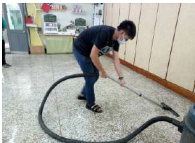
青年認真清潔，每個角落灰塵都不放過！

每年瑞復益智中心會承辦勞工局委託的環境清潔職訓專班，提供身障者為期半年的清潔專業技能培訓，包含基礎清潔知識、一般清潔技能養成、進階清潔實務、就業心態準備、清潔應用實習，職場觀摩、求職面試須知等課程，透過結構化教學及實作訓練，達成「授人以魚，不如授人以漁」的自立目標，讓青年們對於自己即將踏入的社會職場更有方向及概念喔！期待你們能在職場發光發熱，努力創造自我價值。