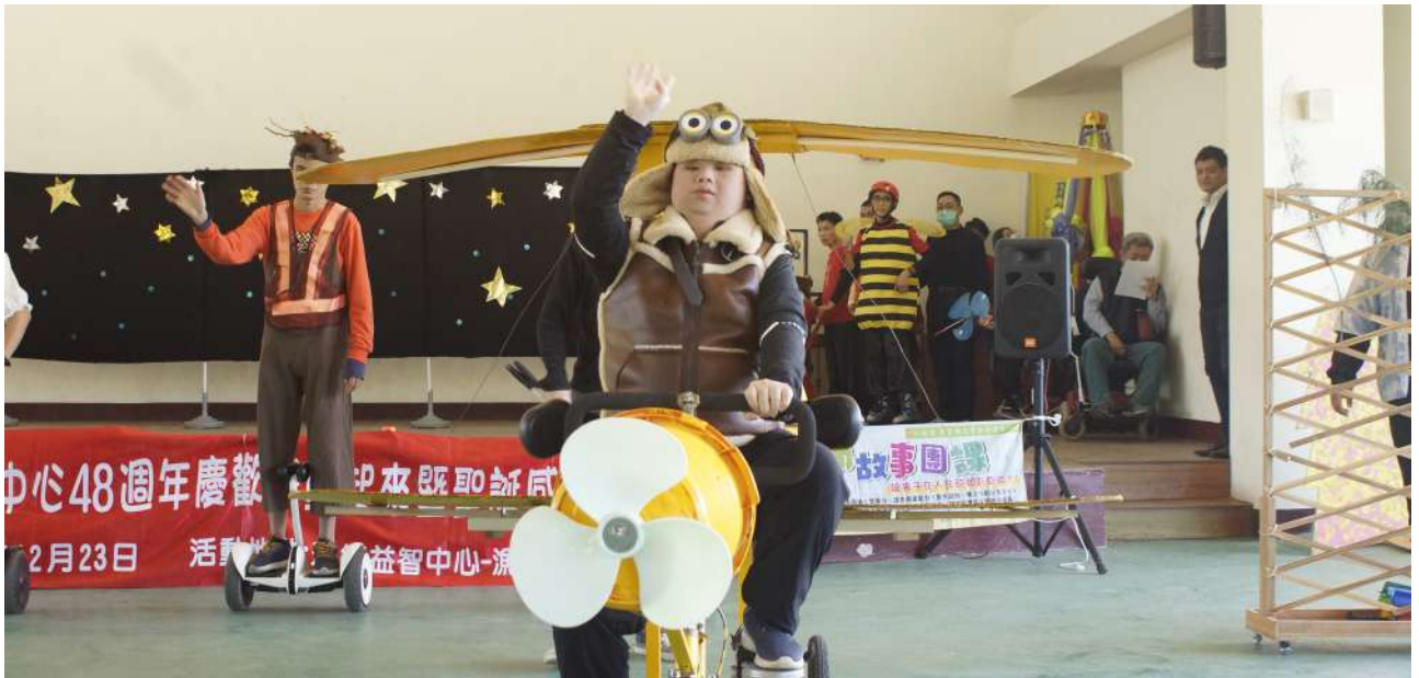
圖 / 資訊專員 文 / 啟能組 組長

這是一齣描述一群生活在漁光島的星星兒發現了小王子所駕駛的飛機，因為暴風雨得關係無法順利降落，最後在星星兒與樹精靈的幫忙下，小王子終於順利降落，並帶來一系列歡慶的故事。12 月 23 日的這一天是瑞復益智中心 48 週年的校慶，這一次我們由成立兩年的 3+1CRPD 舞團領軍，率領瑞復大小朋友一同演出《小王子的奇幻之旅》。為 2 年後瑞復的 50 週年慶，一起登上市立文化中心演藝廳而準備。