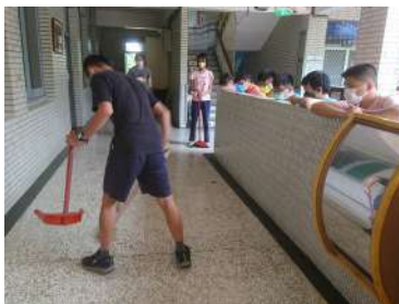
青年觀摩正確使用掃地器具方法。