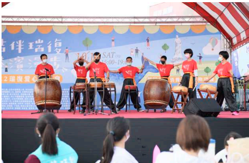
圖 / 資訊專員 文 / 社會事務組 組長

瑞復益智中心這年第 24 屆園遊會活動 -《結伴瑞復 港濱漫步 -2022 瑞復愛心園遊會》改在林默娘公園對面廣場舉辦。