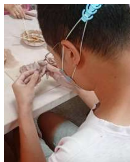
啟能組小豪喜歡捏製狗狗