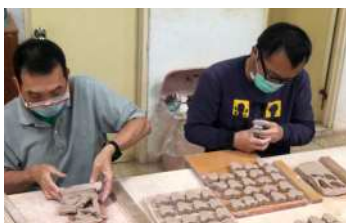
青年們利用輔具壓製陶底座

天然艾草條是為瑞復友善環境的產品之一，青年借力教保員設計的輔助工具手卷艾草條，搭配陶藝教室捏製的底座和陶盤使用，是為今年度中心耐震補強募款專案的回饋品，由跨據點、跨組別的瑞復青年、教保員與陶藝老師合力製作，於年初開始製作共計約 6,000 個以上的陶盤底座，已於今年九月份分批出貨完成。