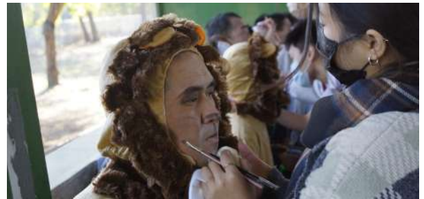
感謝台南護理專科學校化妝品應用科學生，替服務對象化妝。

本次表演是瑞復首次挑戰的全新故事《小王子的奇幻之旅》，闊別三年後，瑞復又新增了兩個新的社區據點 - 愛·幸福與愛·安豐工作坊，更多青年加入瑞復一同演出。劇情新鮮又奇幻，在場來賓個個看得目不轉睛。特別是經由台南護理專科學校化妝品應用科的師生運用巧手為青年及小朋友畫出精美的舞台妝，更增添戲劇張力！