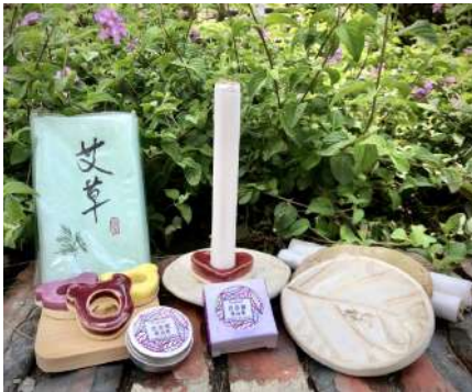
凹豆咖露營天使組。

今年度受邀參與 2022 富邦慈善公益市集，中心推出『凹豆咖露營天使組』於 igiving 公益網 進行線上義賣，義賣收入用於智青工作獎勵金與身心障礙服務經費，是為自立支持之實踐。此組合內含 - 手卷艾草條、拉菲爾精油膏、萬用樹葉陶盤、艾草條陶底座 - 陶盤與底座皆由陶藝教室參與青年進行製作，釉色依活動需求進行客製化，此系列組合適用於露營活動中，以天然無毒的方式驅蚊和撫慰蚊癢不安，對於人、自然環境和社會，友善價值的倡議和推行是為中心之核心理念與使命，透過藝術陪伴和創作，達到療癒與自立支持之目標。