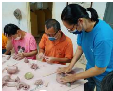
志工小汶陶盤製作初體驗