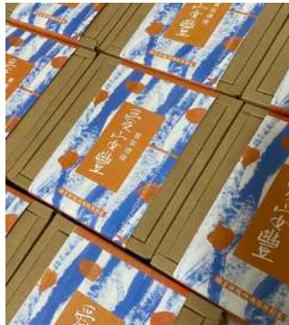
新服務據點啟用儀式，賓客伴手禮。