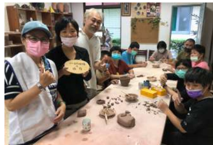
志工阿菁入班同樂