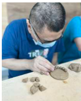
林森生活園阿宏的捏陶樂

陶藝教室全年度 (除國定假日外) 固定每周三和周四於安平本部有課程活動進行，啟能組青年以班級為單位輪流參與常態課程，每周一陶藝老師也會至外展服務據點-林森生活園-進行陶藝活動，於課程中陶藝老師和教保員進行藝術陪伴，以不設限主題的方式讓青年盡情發揮，透過手捏陶土訓練手部功能和豐富其觸覺統合經驗。陶土不僅僅是創意轉譯的媒介，更是一種表達方式，對於穩定情緒有所助益，教保員也得以從青年的作品或創作過程察覺其情緒狀態。