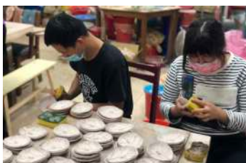
小作所青年修飾陶盤土坯