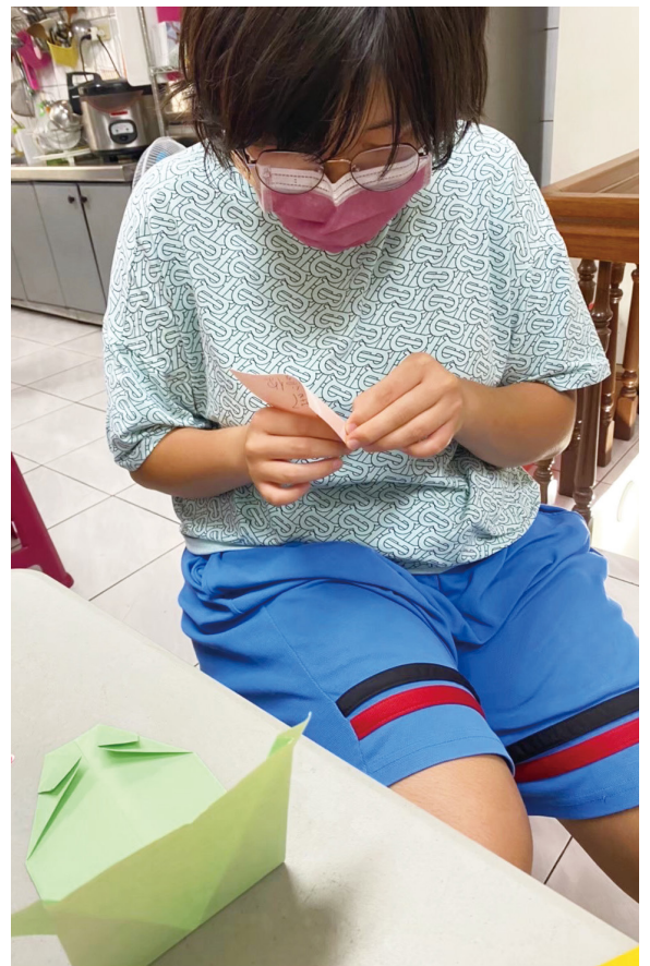
(愛希望工作坊認真工作的小倫)