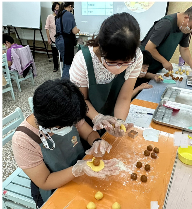
親子手足同樂趣—烘焙手作

今年度共規劃辦理八場次，1場照顧者 FUN 輕鬆 (綠色療癒力—遛植物! 移動式盆栽創作)、2場未來生活規劃 (託付幸福—監護宣告與安養信託法律講座、我的醫療我做主—病主法與預立醫療 ACP 講座)、2場親子手足同樂趣 (親子烘焙—鳳梨酥在家做、親子桌遊—百元桌遊帶你飛)、3場多元銜接資踏查 (社區居住之社區家園、住宿型機構、長照系統喘息服務)，廣邀相關議題領域專家，包含園藝治療師、法扶律師、教學醫院社工師、職訓專業人員進行講座與教學指導；實地踏查活動則直接邀請參與者前往服務提供之組織單位，了解現行多元模式與服務現場實況，場域導覽提升參與者體驗感受，有助於照