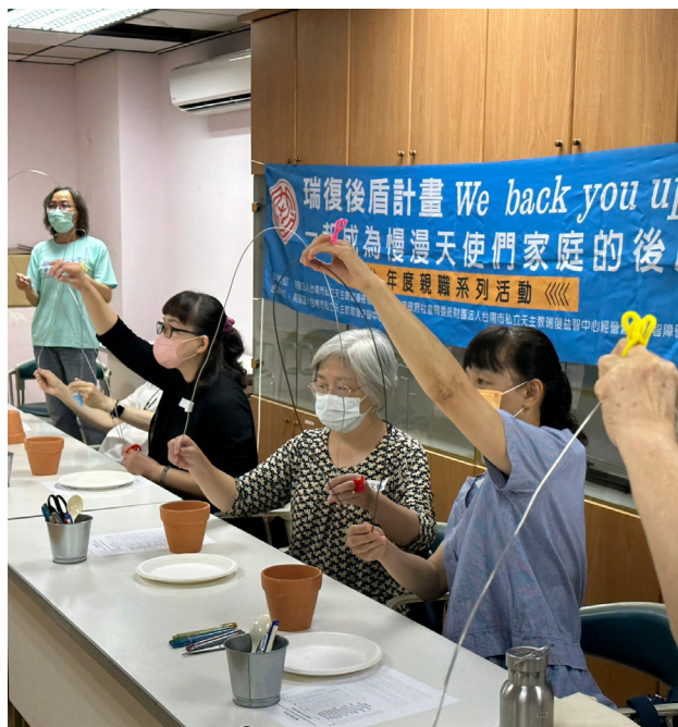
照顧者 FUN 輕鬆—園藝治療

透過定期舉辦支持團體活動，協力慢慢天使們家庭能更廣泛多元認識與習得相關專業知能，對未來生活照顧規畫能有更多樣的想像，並增強運用社會資源的能力，瑞復後盾計畫核心宗旨之中長期目標階段：支持團體—互助團體—自助社群，藉由資訊講座、專業知能研習、社群小聚，逐步落實永續目標，讓障礙者與其家庭能共融社會日常，建立自信與豐富的生活。