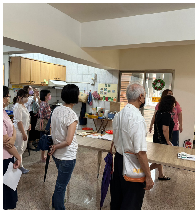
多元銜接資源踏查—社區家園