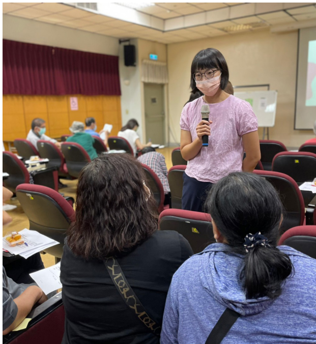
監護宣告與安養信託法律講座

今年度共規劃辦理八場次，1場照顧者 FUN 輕鬆 (綠色療癒力—遛植物! 移動式盆栽創作)、2場未來生活規劃 (託付幸福—監護宣告與安養信託法律講座、我的醫療我做主—病主法與預立醫療 ACP 講座)、2場親子手足同樂趣 (親子烘焙—鳳梨酥在家做、親子桌遊—百元桌遊帶你飛)、3場多元銜接資踏查 (社區居住之社區家園、住宿型機構、長照系統喘息服務)，廣邀相關議題領域專家，包含園藝治療師、法扶律師、教學醫院社工師、職訓專業人員進行講座與教學指導；實地踏查活動則直接邀請參與者前往服務提供之組織單位，了解現行多元模式與服務現場實況，場域導覽提升參與者體驗感受，有助於照