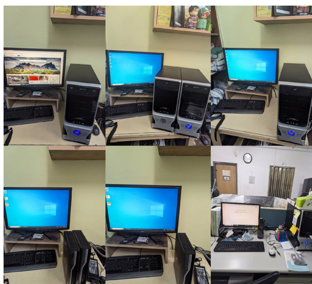
捐贈 6 台電腦，提升許多行政效率