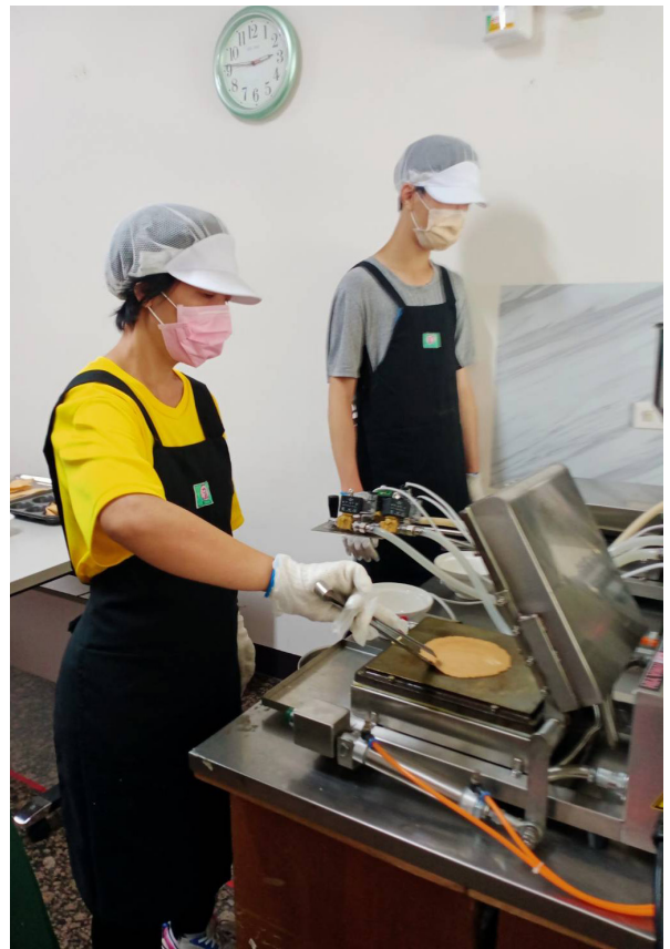
▲ 青年動手操作機器製作米香薄餅

當機器送到工作坊時，青年們無不好奇的觀望著這突來大型物件，操作前教保員帶著青年認識機器與如何安全的操作…，看著機器運作隨即煎烤出一片片米香薄餅，每位青年都張大了眼睛覺得好厲害啊！好好吃啊！，帶著青年們自己操作機器，自己煎烤出香脆的米香薄餅，從他們的眼神中看見了自信與驕傲。