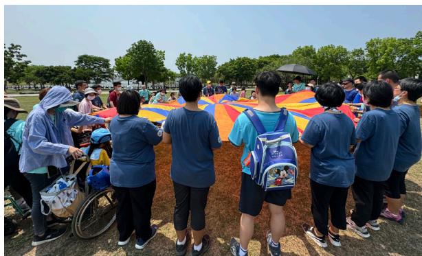
▲大家開心的在草地遊玩氣球傘遊戲

我們將帶著這份喜悅，持續努力為最弱小的兄弟服務，讓瑞復的青年和孩子們在愛中成長，邁向充滿希望的未來。